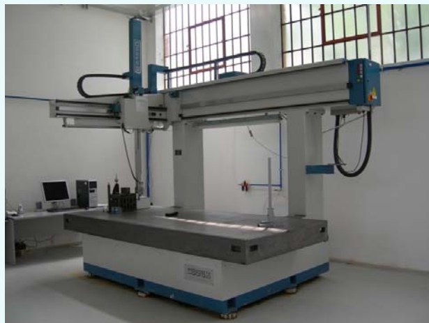
Macchina di collaudo COORD3 modello TR32

La Fimex Automotive si propone come partner di fiducia per tutta la sua clientela, fornendo un supporto tecnico completo dall'idea del cliente fino alla realizzazione del prodotto.