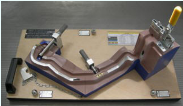
Calibro di controllo in resina