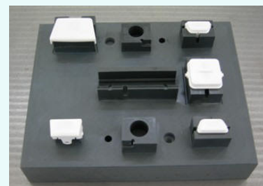
Posaggio per controlli 3D