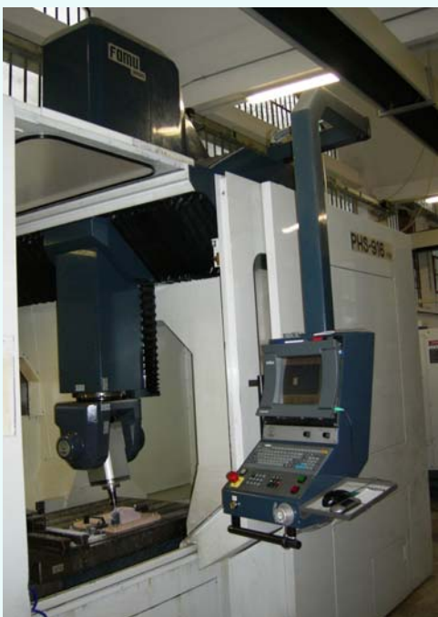
CNC 5 assi FAMU PARPAS PHS-916 FIVE e Controllo SELCA

La competenza dei suoi tecnici, le tecnologie all'avanguardia ed il controllo della produzione consentono di ottenere un elevato standard qualitativo affidabile a costi contenuti.