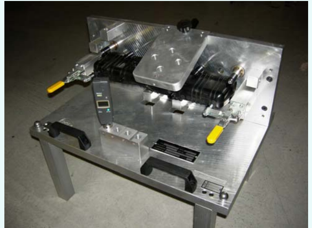
Calibro di controllo

La Fimex Automotive segue tutte le fasi della realizzazione del prodotto: