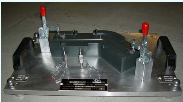
Posaggio per controlli 3D